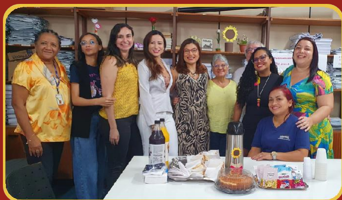
CEPS COMEMORA O DIA DA MULHER