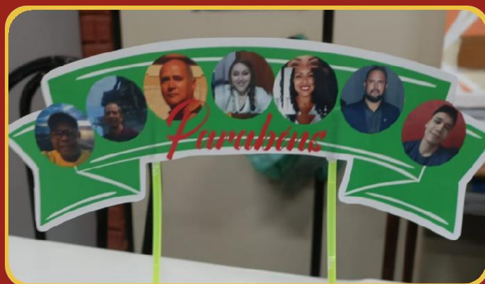
FESTEJANDO OS(AS) ANIVERSARIANTES DE NOSSO CEPS